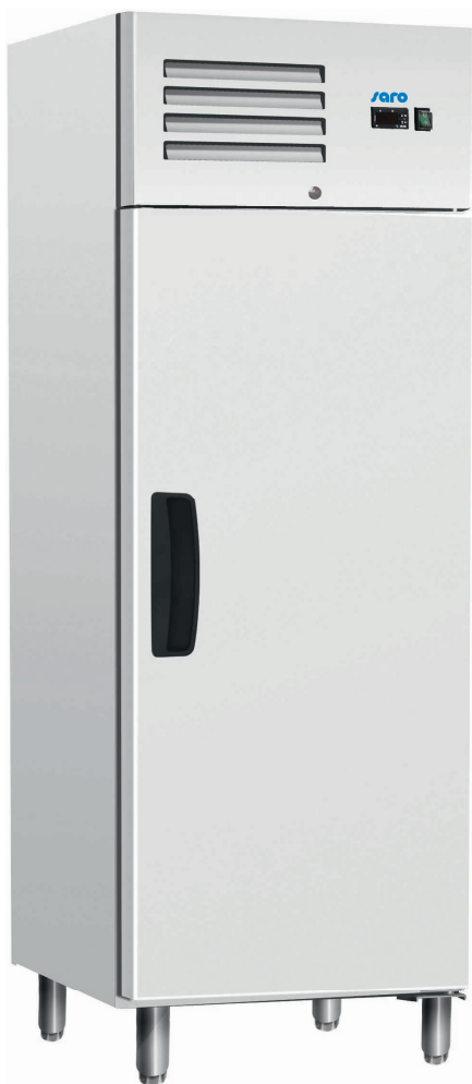
GN 600 BTB