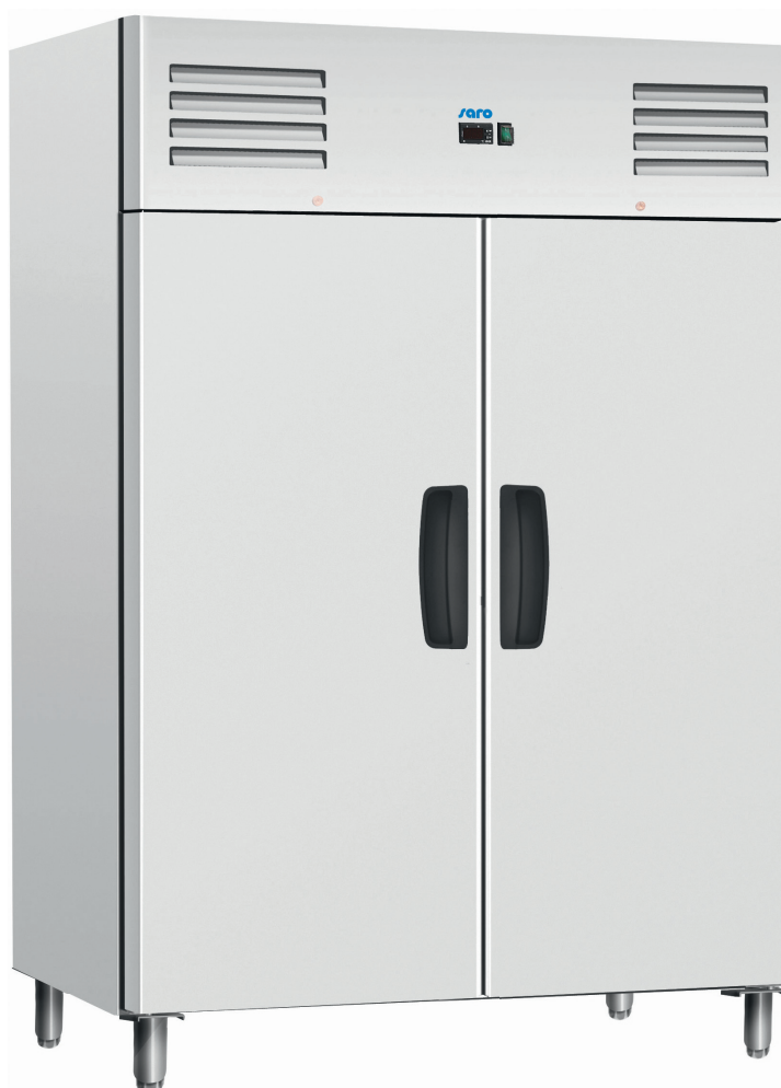
GN 1200 BTB